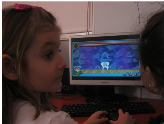
“Vreau să am dinți albi și strălucitori”-exerciții practice