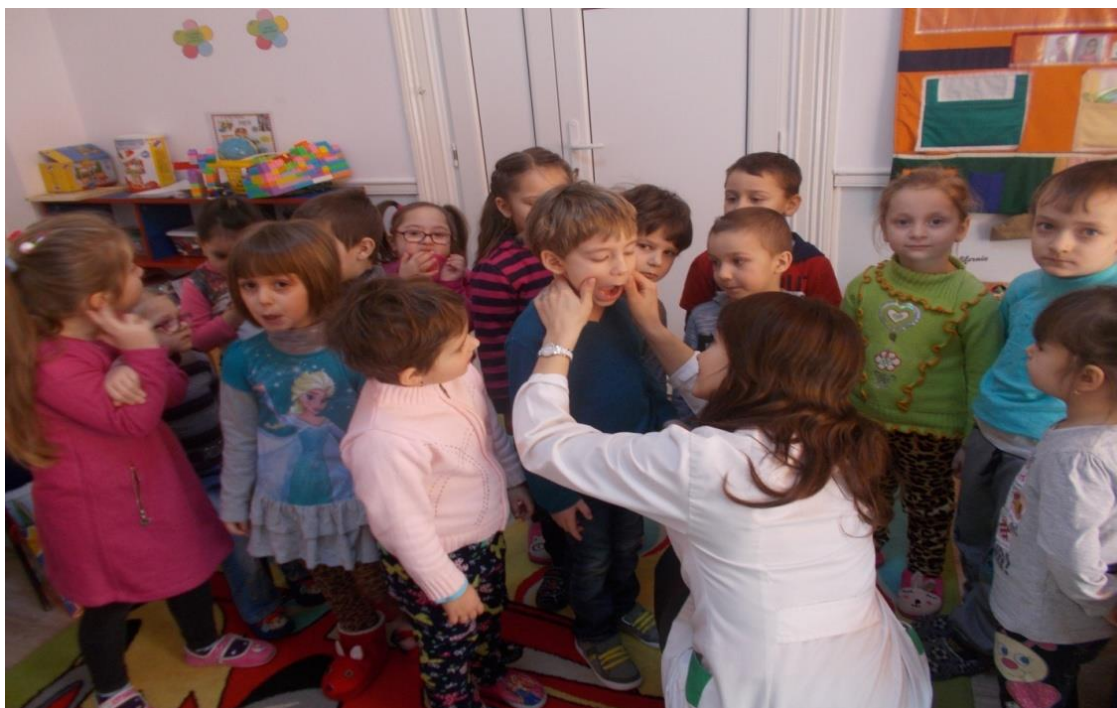
“Dințișorii mei, cum să am grijă de ei?”- întâlnire cu un medic stomatolog